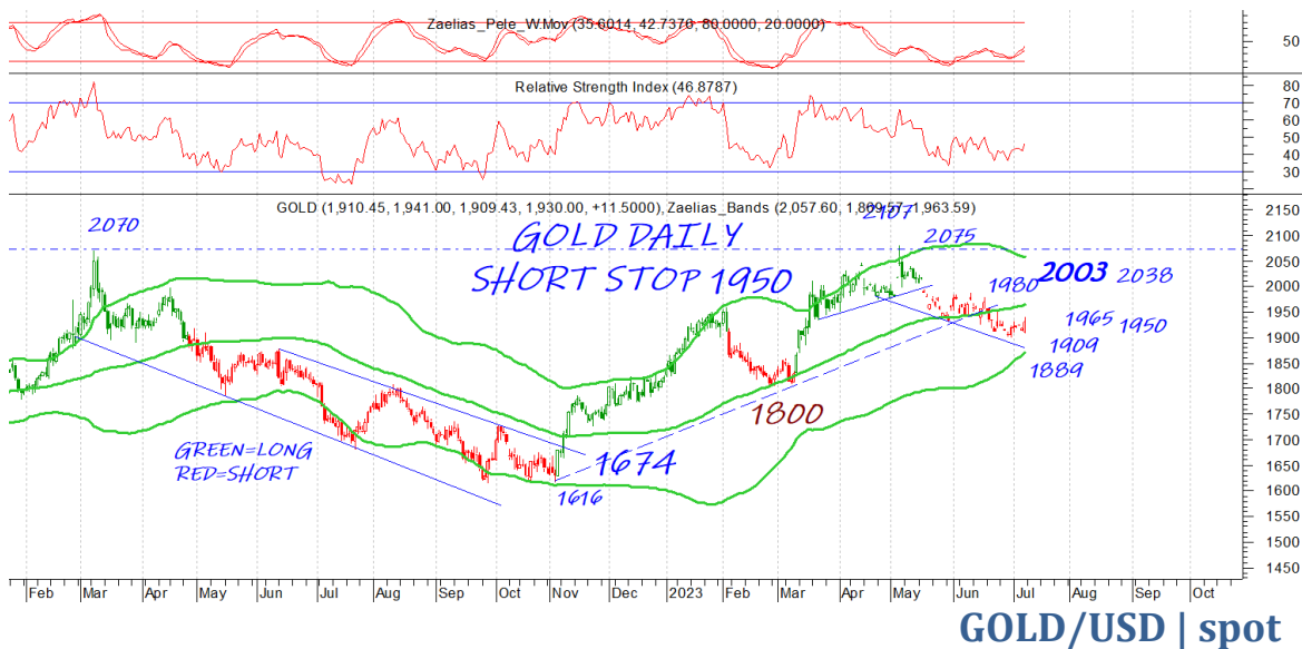
GOLD/USD | spot

Η πτώση του δολαρίου την Παρασκευή βοήθησε στην αντίδραση. Το 1950 σε κάθε περίπτωση χρειάζεται κατοχύρωση για να πάρουμε αγοραστικό σήμα. Το 1909 και 1889 κοντινές στηρίξεις.