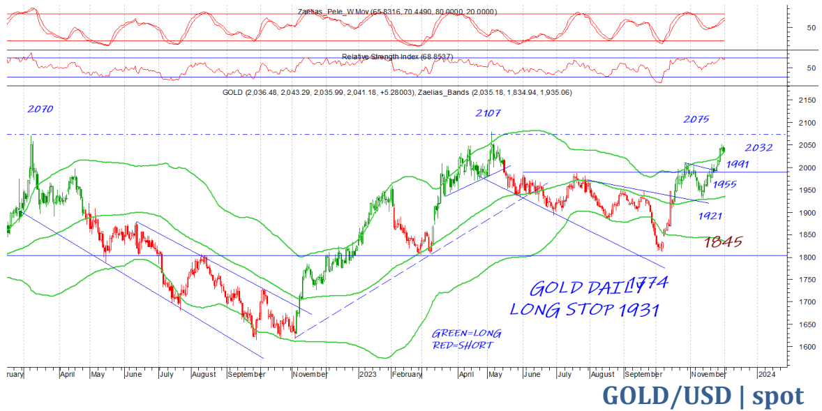
GOLD/USD | spot

Όσο κλείνει πάνω από το 2030 η τάση είναι επιθετική με το 2075 επόμενο στόχο. Μία κατοχύρωση του 2030 μπορεί να μας φέρει στην ζώνη του 1991